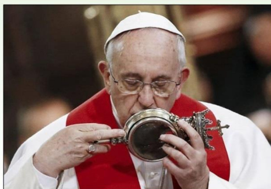
Radio Vatican - La voix du Pape et de l'Eglise en dialogue avec le monde -

ET ALORS NOUS EXPÉRIMENTERONS LA GRÂCE D'UNE VÉRITABLE ET PARFAITE TRANSFORMATION